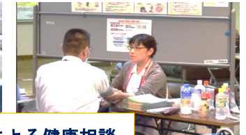
薬剤師、栄養士、理学療法士、看護師による健康相談