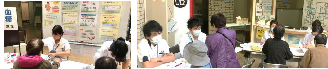
薬剤師、管理栄養士、理学療法士、看護師による健康相談